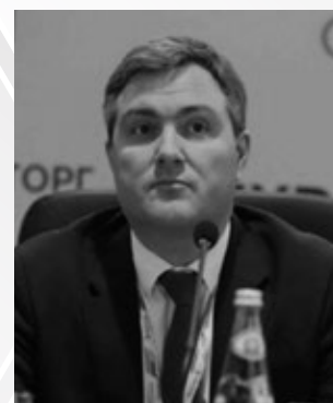
Радинский Константин Олегович

Президент Союза нефтегазопромышленников России