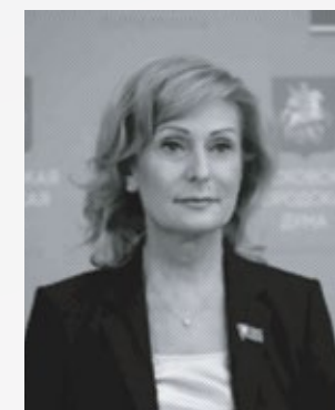
Святенко Инна Юрьевна

Председатель Комитета Совета Федерации ФС РФ по социальной политике