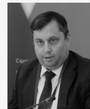
Нижегородцев Тимофей Витальевич

Директор департамента лекарственного обеспечения и регулирования обращения медицинских изделий Минздрава РФ