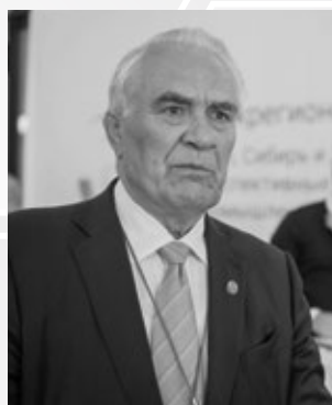
Шмаль Геннадий Иосифович

Президент Союза нефтегазопромышленников России