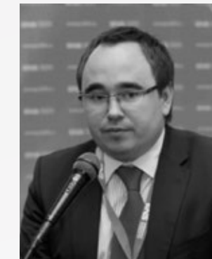
Воротницкий Владислав Валерьевич

Председатель комитета Государственной Думы ФС РФ по энергетике