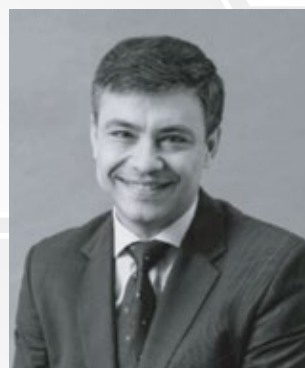
Морозов Дмитрий Анатолевич

Председатель комитета Госдумы по охране здоровья