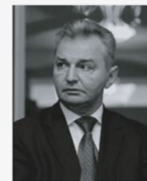
Каграманян Игорь Николаевич

Председатель Комитета Совета Федерации ФС РФ по социальной политике